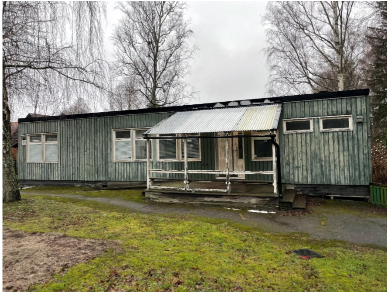
Den tomställda förskolan.